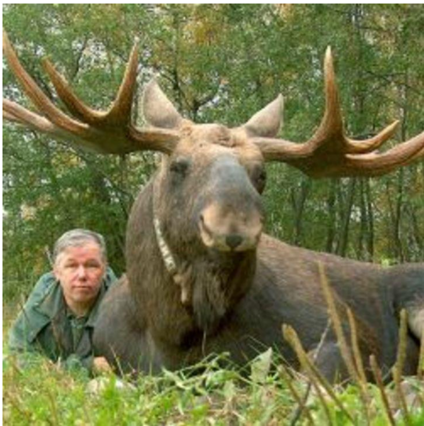
Лось у порівнянні з людиною.

Якщо вас зацікавила ця тема і ви хочете дізнатися: які види лосів існують у природі, що їдять ці тварини, чим лось відрізняється від оленя та багато іншого, то під конспектом цього уроку є кнопка «Цікаве про лосів», натиснувши на яку ви зможете ближче познайомитися із цим мешканцем лісів.